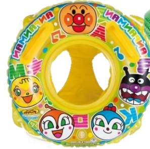
ひも付きの浮き具