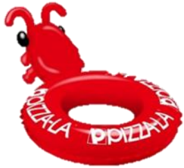
ショルダー型浮き具