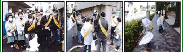
集合・清掃風景写真

千駄ヶ谷社会教育館からも4月に着任した社員1名が参加し、地域の皆さんと共に清掃活動を行いました。