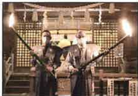
区長と下嶋議長による火入れ

平曲／竹生島詣(ちくぶしまもうて) 須田誠舟 狂言／附子(ぶす) 三宅右近 能／経政(つねまさ) 櫻間右陣